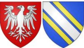
Othon 1er de Bourgogne-Comté Comte de Bourgogne x Marguerite de Blois °1170 +1230