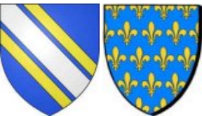
Thibaut V le Bon de Blois °12/8/1130 Vitry la Ville(51) +1191 St Jean d'Acre(Israel) Comte de Blois, de Châteaudun et de Chartres. x 1164 Alix de France °4/10/1150 Saint Waast(59) +11/9/1195 Saint Waast(59) Comtesse de Blois.