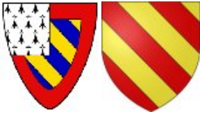
Henri 1er de Bourgogne-Montagu x Isabeau de Thoire-Villars