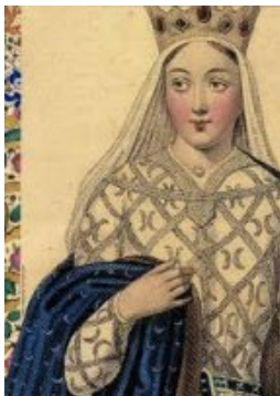
Louis VII, le Jeune puis le Fleuri de France (Capétien) °1121 Paris + 19/09/1180 Paris Roi de France, Duc d'Aquitaine X 22/07/1137 Bordeaux, Aliénor d'Aquitaine °1122 +1204 Reine de France et d'Angleterre, Duchesse d'Aquitaine, Comtesse de Poitiers. Participe à la deuxième Croisade avec son 1er Mari le Roi de France Louis VII (m1137) Mariage annulé le 21/03/1152 pour motif de consanguinité aux 4° ou 5°, le divorce n'existe pas à l'époque. Très belle, froide et réservée, esprit libre et enjouée. Elle déplaît à la cour

pour ses tenues légères. Elle donne les bases du Droit Maritime.