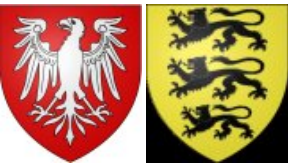
Othon II de Bourgogne-Comté Comte de Bourgogne. x Béatrix II de Hohenstaufen